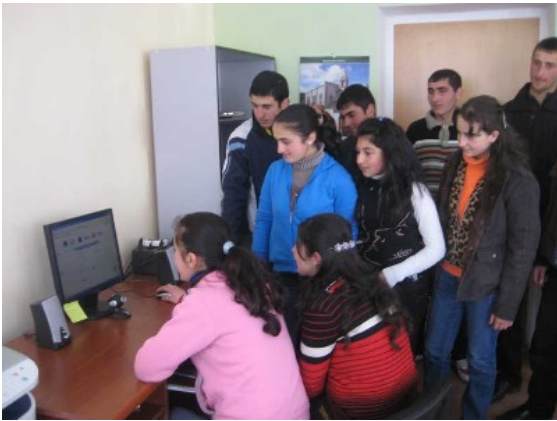
ԵՀԳԾ ակտիվ խմբերի նախաձեռնությամբ շնորհիվ Սյունիքի մարզի երիտասարդները զարգացնում են իրենց համակարգչային գիտելիքները

կիցները կատարեցին մի քանի առաջադրանքներ, որպեսզի ամրապնդեն ձեռք բերված գիտելիքները։ Մասնակիցները կարևորեցին այս նախաձեռնությունը և նշեցին, որ քանզի ՏՏ ոլորտը շատ ընդարձակ է, մեկ հանդիպման ընթացքում անհնար է ներկայացնել գոյություն ունեցող ահռելի քանակով տեղեկատվությունը։ Նրանք ավելացրեցին, որ պետք է պարբերաբար կազմակերպել նման դասընթացներ և ներկայացնել ոլորտի նորությունները և մասնակիցներին զինել լրացուցիչ հմտություններով։ Մասնակիցները նաև այն կարծիքին են, որ սեմինարների ընթացքում ձեռքբերած գիտելիքների շնորհիվ հնարավոր կլինի համացանցի միջոցով իրականացնել համայնքի բնակչության շահերի և իրավունքների ավելի ակտիվ պաշտպանություն։