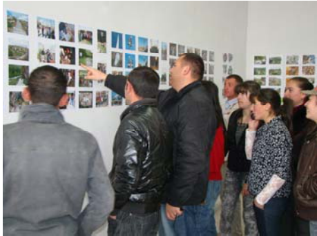
Վարդենիկի համայնքի (Գեղարքունիքի մարզ) բնակիչները համայնքային խնդիրները պատկերող ցուցահանդեսի ժամանակ

հանության խնդիրը, Մշակույթի տան անմխիթար պայմանները, փողոցների լուսավորության խնդիրը, համայնքային ճանապարհների վատ վիճակը և տուրիզմի զարգացման համար անհրաժեշտ պայմանների բացակայությունը: Մոտ 70 հոգի մասնակցեցին ցուցահանդեսին՝ ներկայացնելով 550 լուսանկարներ: Ցուցահանդեսը տեղի ունեցավ մարտի 10-ին համայնքի մշակույթի տանը: ՅԳԾ հրավերով ցուցահանդեսին ներկա էին գյուղապետը, համայնքի բնակիչները, ինչպես նաև ավագանու անդամները: Ցուցահանդեսի ընթացքում համայնքի ղեկավարները համաձայնեցին, որ անհրաժեշտ է հնարավորինս շուտ լուծել համայնքի առավել հրատապ խնդիրները: Առաջարկվեց ցուցահանդեսը տեղափոխել գյուղապետարանի սրահ և մի կողմում փակցնել առկա խնդիրները բարձրաձայնող, իսկ մյուս կողմում՝ արդեն լուծված խնդիրները պատկերող լուսանկարներ: Ըստ Վարդենիկի բնակիչների՝ այս միջոցով համայնքում առկա խնդիրները անընդհատ կգտնվեն ուշադրության կենտրոնում և բոլոր հնարավոր միջոցները կծեռնարկվեն դրանց լուծման համար: