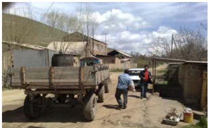
Աշոտավանի ՅԳԾ-ի նախաձեռնության շնորհիվ համայնքի աղբահանության խնդիրը լուծված է

ներն ու ՅԳԾ գործունեությունը: Կայքէջը համայնքին հնարավորություն կընձեռի ներկայացնել իրենց ձեռքբերումները և բարձրաձայնել համայնքային խնդիրները: Տեղական իշխանություններն իրենց հերթին հնարավորություն կունենան հանրությանը ներկայացնել իրենց ընթացիկ աշխատանքները և ապագա ծրագրերը: ՅԳԾ անդամները նախատեսում են մայիս ամսին կազմակերպել կայքէջի պաշտոնական շնորհանդեսը տեղական իշխանություններին, համայնքի բնակչության, ՅԳԾ անդամների, հարևան համայնքների և այլ հյուրերի մասնակցությամբ: ՅԳԾ անդամները գտնում են, որ ոստկայքը համայնքի բնակիչների համար կծառայի որպես տեղեկատվության մատչելիության բարձրագույն միջոց և կնպաստի տեղական իշխանությունների հետ երկխոսության և համագործակցության զարգացմանն ու ամրապնդմանը: