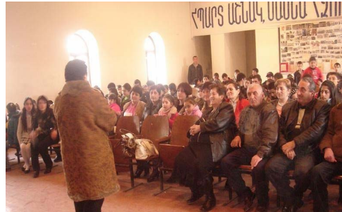
Աշնակի ԵԳԱ անդամները (Արագածոտնի մարզ) նշում են ակումբի հիմնադրման չորրորդ տարեկիցը՝ ներկայացնելով իրենց ձեռքբերումներն ու ապագա ծրագրերը

թյանը իրազեկելու կոռուպցիայի և հակակոռուպցիոն մեթոդների վերաբերյալ, ինչպես նաև խրախուսելու պայքարել կոռուպցիոն դեպքերի դեմ: Միջոցառումը տեղի ունեցավ համայնքի մշակույթի դահլիճում: Հյուրերի շարքում էին գյուղապետը, տարբեր ՀԳ-ների ներկայացուցիչներ, գյուղապետարանի աշխատակիցներ, ուսուցիչներ, համայնքի բնակիչներ ինչպես նաև հարևան Դավթաշեն և Կարմրաշեն համայնքների ԵԳԱ/ՀԳՀ անդամներ: ԵԳԱ անդամները շատ ուրախ էին և ոգևորված: Նրանք ևս մեկ անգամ արժեկրեցին իրենց աշխատանքն ու գործունեությունը, որը ծավալում են ի նպատակ համայնքի զարգացման և համագյուղացիների բարեկեցության: